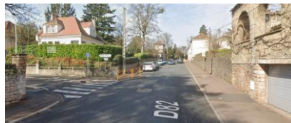
5 Cette zone est très embouteillée aux heures de pointe, notamment en raison de la circulation des bus qui tournent vers le collège Pasteur et qui rendent le carrefour particulièrement dangereux pour les cyclistes. Il en est de même pour le croisement vers l'école Notre Dame. Ces zones sont limitées à 50km/h alors que de très nombreux collégiens traversent quotidiennement cette route matin et soir.