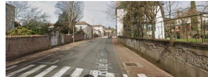
6 Absence totale d'aménagement cyclable tout le long de la rue