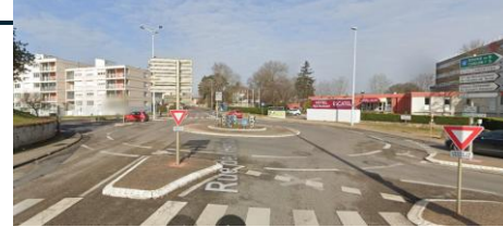
7 Carrefour aménagé avec bande cyclable, qui n'est plus reconnu comme un aménagement cycliste sécurisé, et dans lequel les voitures circulent trop vite